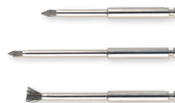
■歯周 再生 NiTi ブラシ Muroo アソート

再聴講 2023年11月11日(土)・12日(日)の弊社主催 本セミナーを受講された方のみ